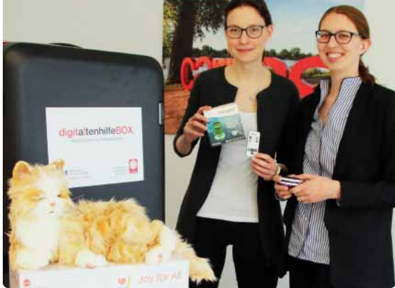
Die »DigitAltenhilfeBOX« mit vielen unterschiedlichen digitalen Hilfsmitteln