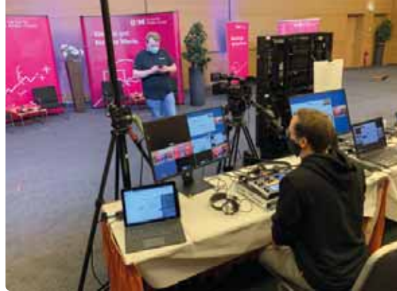
Das 19. Kapitalmarkt-Forum – zum ersten Mal live im Internet