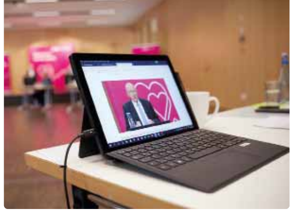
Generalversammlung als Videoübertragung im Internet